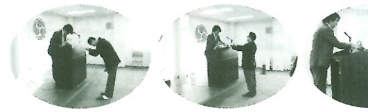
各賞を受賞された方々は、おめでとございました。尚、次回の表彰式は、平成28年5月頃の予定になっております。